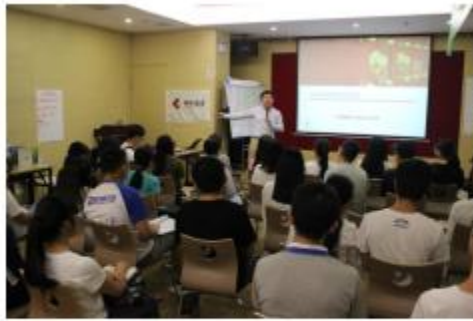
图9：嘉实基金会片区经理分享——大学生与理财