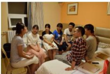
图11：生长时刻：我欣赏、我期待