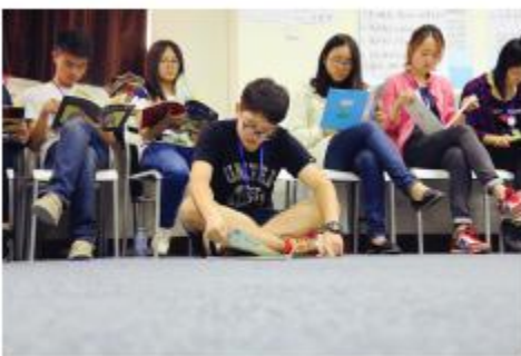
图5：夏令营活动体验——午间阅读