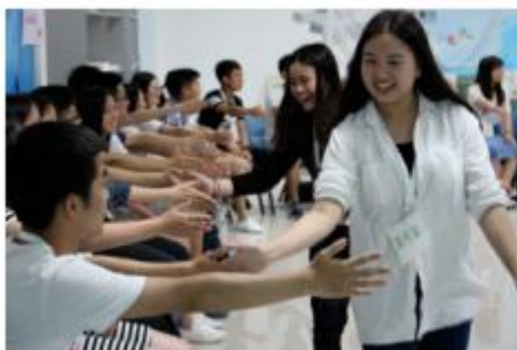
图3：热情洋溢的入场仪式，每个人都像明星般闪耀登场。