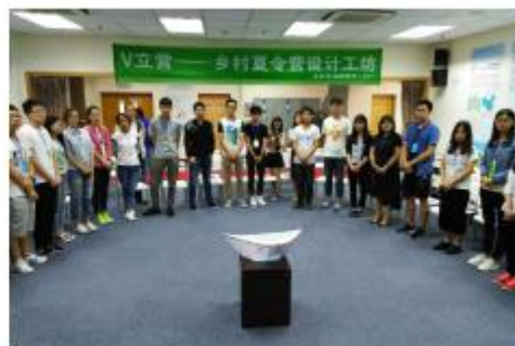
图12：结营仪式：共煮石头汤，启程