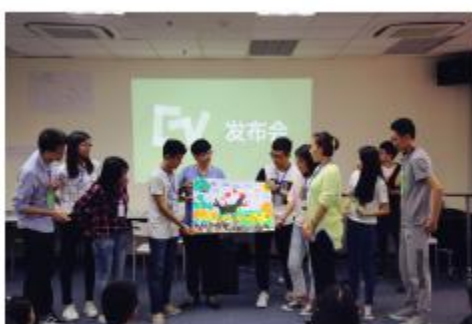
图7：夏令营活动体验——轻轻泥