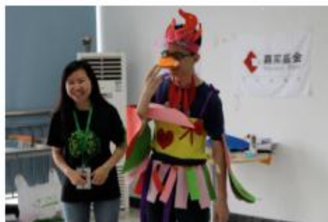
图4：夏令营活动体验——手工