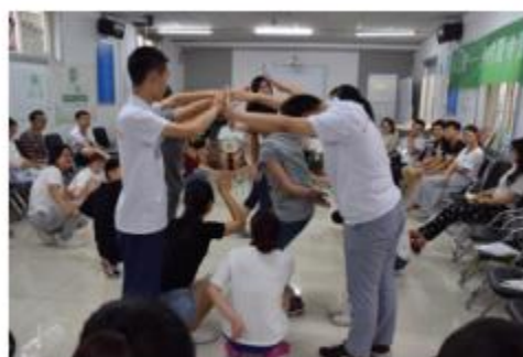
图8：夏令营活动体验——故事圈