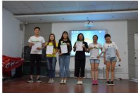
图10：精心准备的结营证书