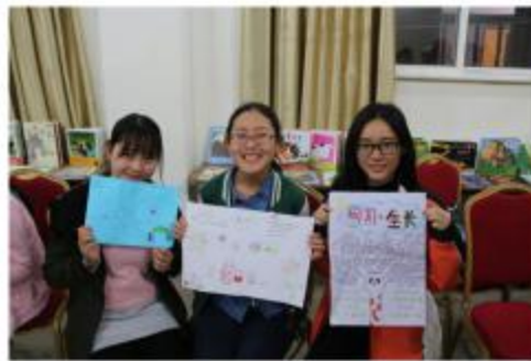
图2：前期个人学习海报分享。