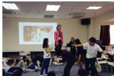
图6：夏令营活动体验——定格雕塑