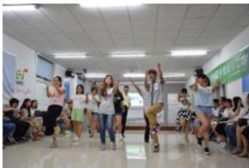
图1：火热的开场舞——你更精彩。